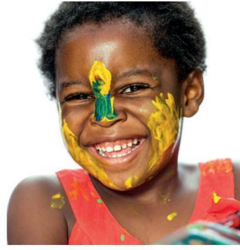
... bei kreativen Angeboten