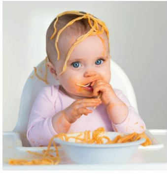
... beim Mittagessen