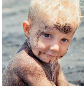
... auf dem Außengelände